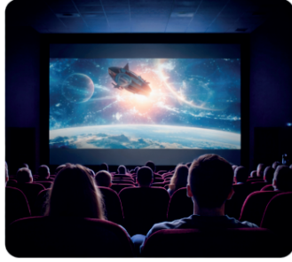
Sinema Etkinliği: 180 TL

4. Bir okulda yıl sonu etkinlikleri kapsamında düzenlenen iki farklı organizasyon aşağıda verilmiştir.