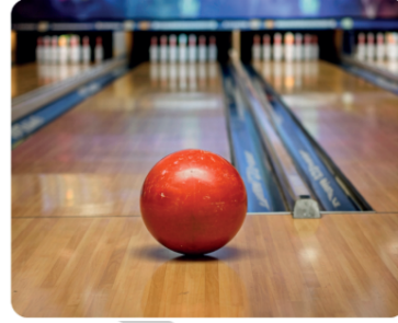
Bowling Etkinliği: 240 TL

Öğrenciler bu etkinliklerden yalnızca birine katılabilmektedir.